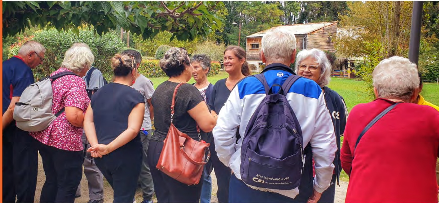
PARC DES LIBERTÉS - LA SEMAINE BLEUE

Le Parc des Libertés favorise un espace de coopération associative, permettant à différentes associations de travailler ensemble sur des projets communs.